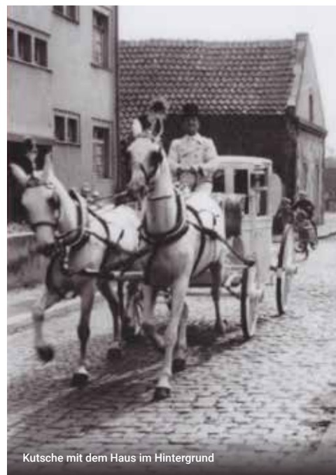
Kutsche mit dem Haus im Hintergrund