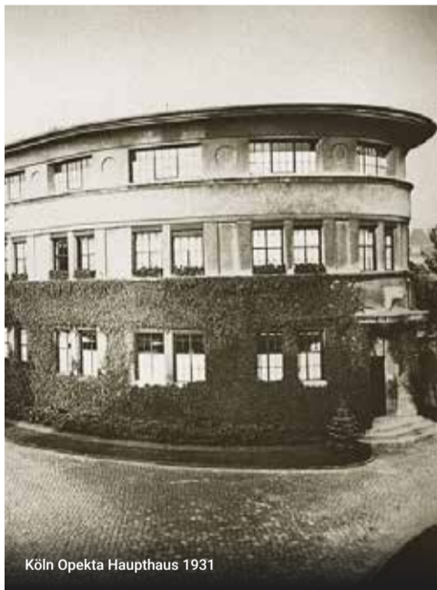
Köln Opekta Haupthaus 1931