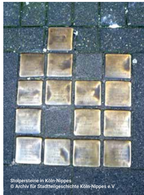
Stolpersteine in Köln-Nippes

Auf dem Erich-Klibansky-Platz nahe des Friesenviertels sprudelt der Löwenbrunnen. Er erinnert an die Deportation und Ermordung jüdischer Kinder und Jugendlicher aus Köln und an eines der Zentren jüdischen Lebens in der Domstadt. Neben einer Synagoge gehörte das Jüdische Gymnasium Jawne dazu. Heute befindet sich hier der Lern- und Gedenkort Jawne, der die Geschichte der Schule und ihrer Schüler*innen lebendig hält. Eine Führung durch die Ausstellung und ein Gang um den ehemaligen Schulhof machen den Ort erfahrbar.