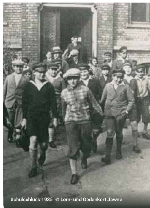
Schulschluss 1935